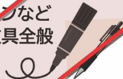
ペンなど 文具全般