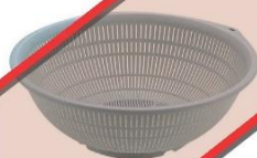
プラスチック製の ボウル、ざる