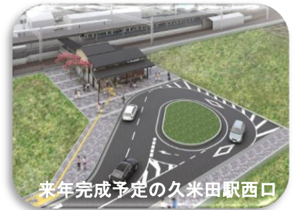
来年完成予定の久米田駅西口

さて今月は、地域コミュニティの中心的存在である我が町会の目指していることを紹介させていただきます。